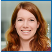
Dr. Anna Christmann Bündnis 90/Die Grünen