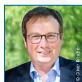
Oliver Krischer Bündnis 90/Die Grünen