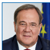
Armin Laschet CDU