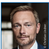
Christian Lindner FDP