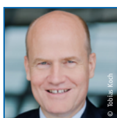
Ralph Brinkhaus CDU